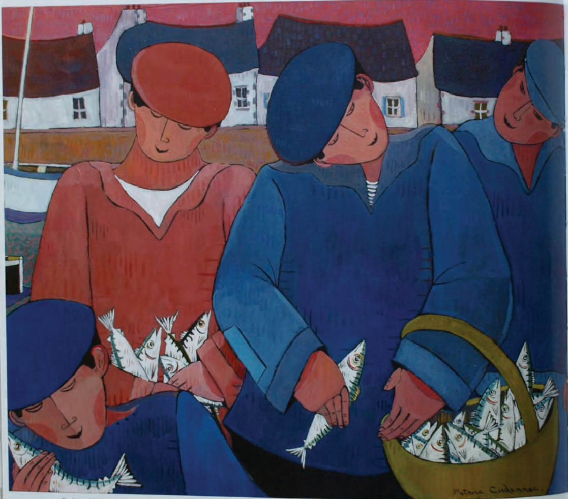
Sur le quai, huile sur toile, 92 x 73 cm, 2013.