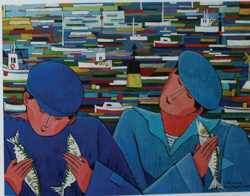
Pêcheurs devant le port joyeux, huile sur toile, 61 x 46 cm, 2014.

(Têtes penchées et yeux fermés/visages sereins et vêtements d'apparat/les Bretons, sur les tableaux de Patrice/gardent jalousement les secrets d'un bonheur/dont les simples miettes me suffiraient, pauvre que je suis, à enchanter les matins)